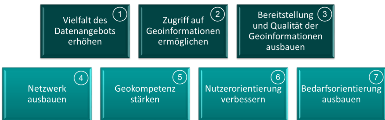
Abbildung 1: Übersicht der Schwerpunkte

Aus diesem übergeordneten Ziel der NGIS 2.0 sind die folgenden sieben Schwerpunkte abgeleitet, die mit konkreten Handlungsfeldern unterlegt werden. Sie umfassen technische Aspekte (Schwerpunkte 1 – 3) sowie organisatorische Aspekte (Schwerpunkte 4 – 7).